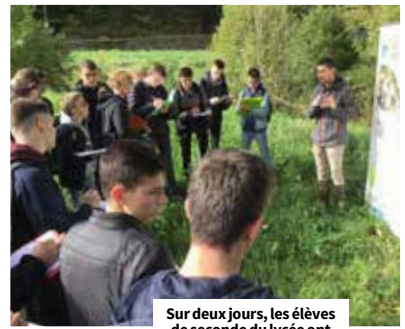
Sur deux jours, les élèves de seconde du lycée ont découvert les actions du Bassin versant Vallée du Léguer, au bord de l'eau à Ploubezre.