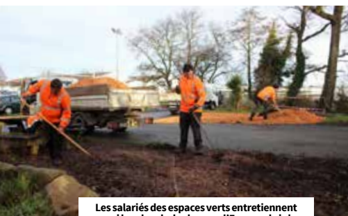
Les salariés des espaces verts entretiennent aussi les abords des locaux d'Emeraude i.d., vitrine de leur savoir-faire.

Entièrement mécanique, simple et efficace, elle peut être installée partout : cantine scolaire, Ehpad, restaurant... L'objectif est de traiter les déchets alimentaires sur place. Après ajout de matière sèche, la montée en température fait baisser de 60 % le volume de déchets. On obtient un précompost que l'on termine dans un composteur classique. Actuellement en phase de production, l'association prévoit d'installer 10 à 15 stations en France cette année, peut-être davantage selon la demande !