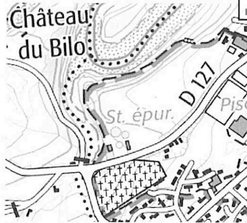
Figure 3 : Carte IGN Topographique (Geoportail)

Au regard de l'impossibilité technique de réaliser le projet d'extension sur la zone 1AUe, le projet ne peut donc être réalisé que sur la partie ouest de la zone à urbaniser à long terme 2AUc (figure 1).