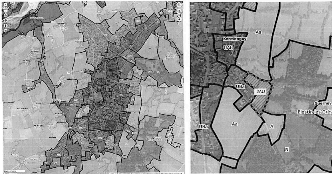
Figure 1: Extrait du PLU actuel

Cette procédure est tenue de respecter les dispositions de l'article L. 153-38 du code de l'urbanisme, lequel indique que « lorsque le projet de modification porte sur l'ouverture à l'urbanisation d'une zone, une délibération motivée de l'organe délibérant de l'établissement public compétent ou du conseil municipal justifie l'utilité de cette ouverture au regard des capacités d'urbanisation encore inexploitées dans les zones déjà urbanisées et la faisabilité opérationnelle d'un projet dans ces zones ».