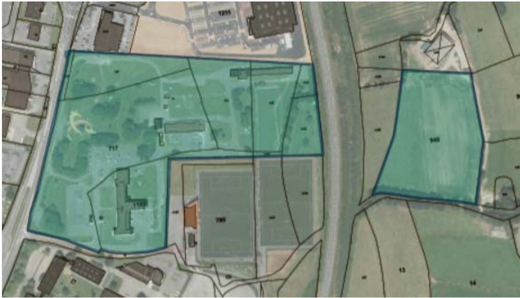
Partie « Cruguil »