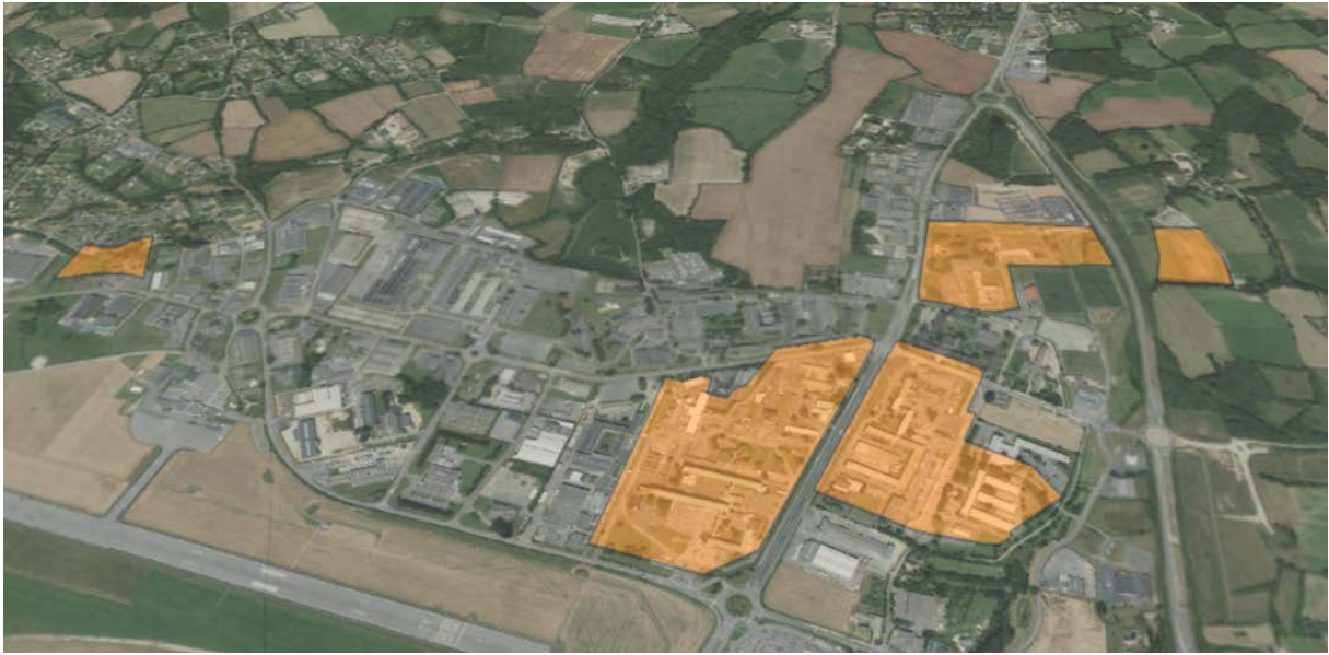
Vue globale des sites Orange sur Pégase à Lannion