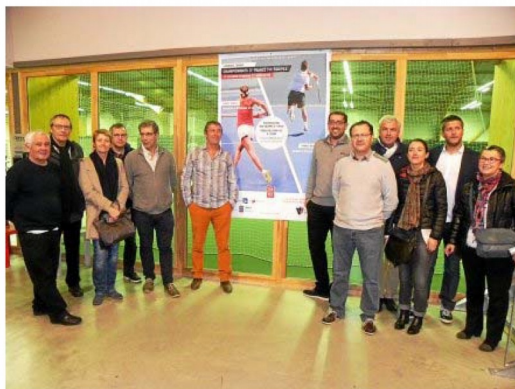
Le Lannion-Tennis a été retenu par la Fédération française de tennis, pour organiser les finales des championnats de France par équipes, début décembre.

Publié le 07 novembre 2016 à 14h40 Modifié le 07 novembre 2016 à 14h49