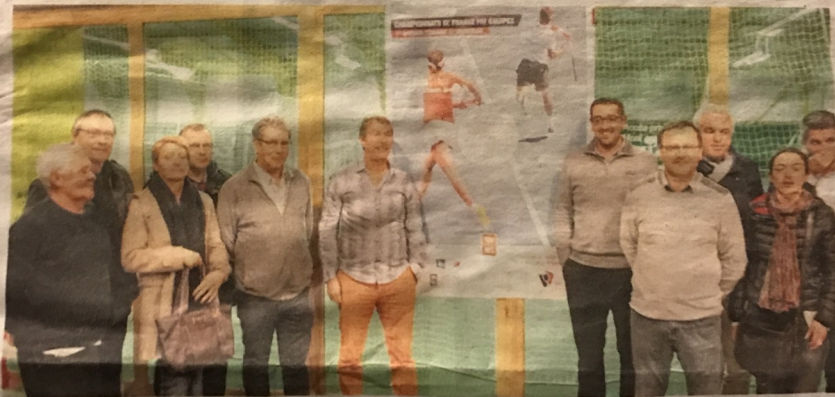
Les bénévoles sont déjà à pied d'œuvre pour l'organisation du championnat de France par équipes.

Quatre simples et deux doubles pour les hommes et autant pour les femmes. Deux jours de compétition au plus haut niveau et l'espoir d'accueillir les plus grands joueurs français : « Aujourd'hui le championnat a débuté, les listes par clubs sont complètes et impossibles à changer. Mais on ne connaîtra les noms des clubs fina-