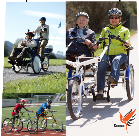
Design graphique et illustration : Arnaud Chauvel

C'est dans cette optique qu'intervient l'événement Un vélo pour tous. Pendant trois jours, en parallèle de Mai à vélo, du Tour de Bretagne cycliste, des 60 ans de l'Adapei Nouelles et des 100 ans de Trestel, le public pourra découvrir différents modèles de vélos adaptés aux personnes à mobilité réduite (PMR) ou aux personnes âgées : tricycle musculaire ou à assistance électrique, modèle à propulsion podale, modèles accueillant un fauteuil, modèles avec accompagnateur. Les objectifs sont multiples : changer le regard sur le handicap, tester des modèles adaptés et fédérer les différents acteurs du territoire. A terme, Lannion-Trégor Communauté envisage de se doter de vélos adaptés pour élargir son offre à tous les publics.