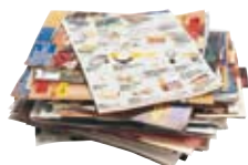
● Ar brudfollennoù