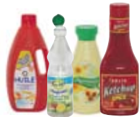
● Les bouteilles d'huile, vinaigrette, flacons de mayonnaise et sauce tomate