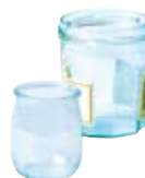
● Ar podoù