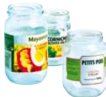
● Ar podoù-mir