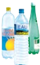
● Ar boutailhoù treuzwelus : dour, chug-frouezh, soda...