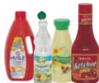
● Ar boutailhoù eoul, gwinegenn, ar buredoù maonez ha chaous tomatéz