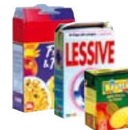
● Les boîtes et les suremballages en carton