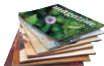
● Ar c'helaouennoù