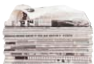
● Ar c'hazetennoù