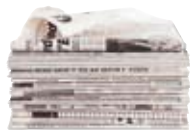
● Les journaux

● Je les mets propres et secs dans les contenants bleus (sacs, bacs, colonnes) :