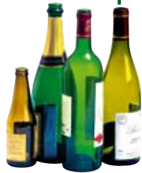
● Les bouteilles

● Je les mets propres et secs dans les contenants verts (colonnes) :