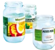
● Les bocaux de conserve