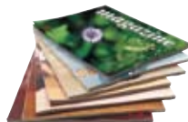
● Les magazines