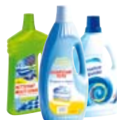
● Les flacons d'adoucissant, de lessive, de javel...