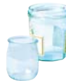
● Les pots