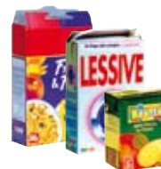
● Ar boestoù hag ar pakadurioù kartoñs