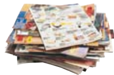
● Les prospectus